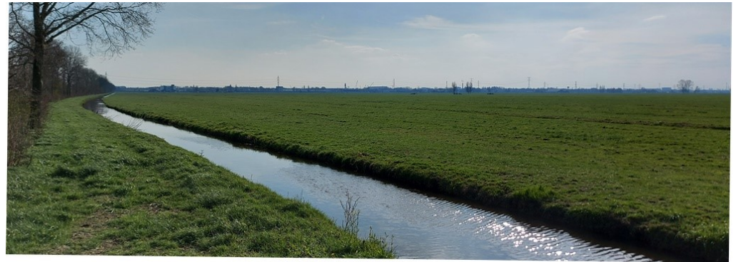
Polder Sliedrecht, zonder windmolens of zonnenvelden.